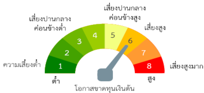
ปัจจัยความเสี่ยงที่สำคัญ